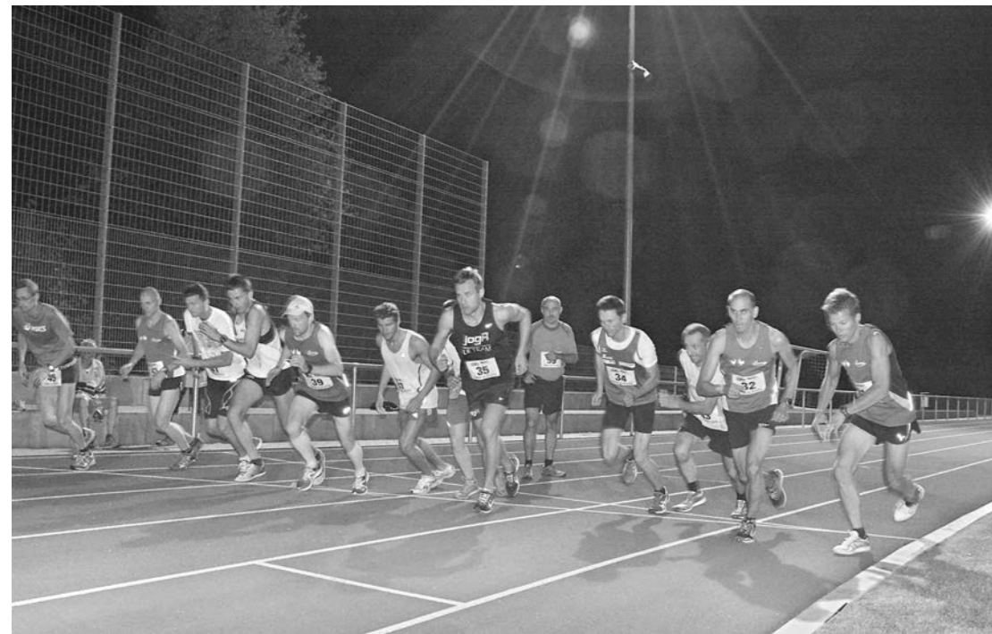
Drei Tage – drei Läufe: Den Auftakt zur BBT-Challenge bildete am Freitagabend der 3000-Meter-Prolog im Sportpark Zell. 55 Teilnehmer gingen in vier Läufen an den Start.