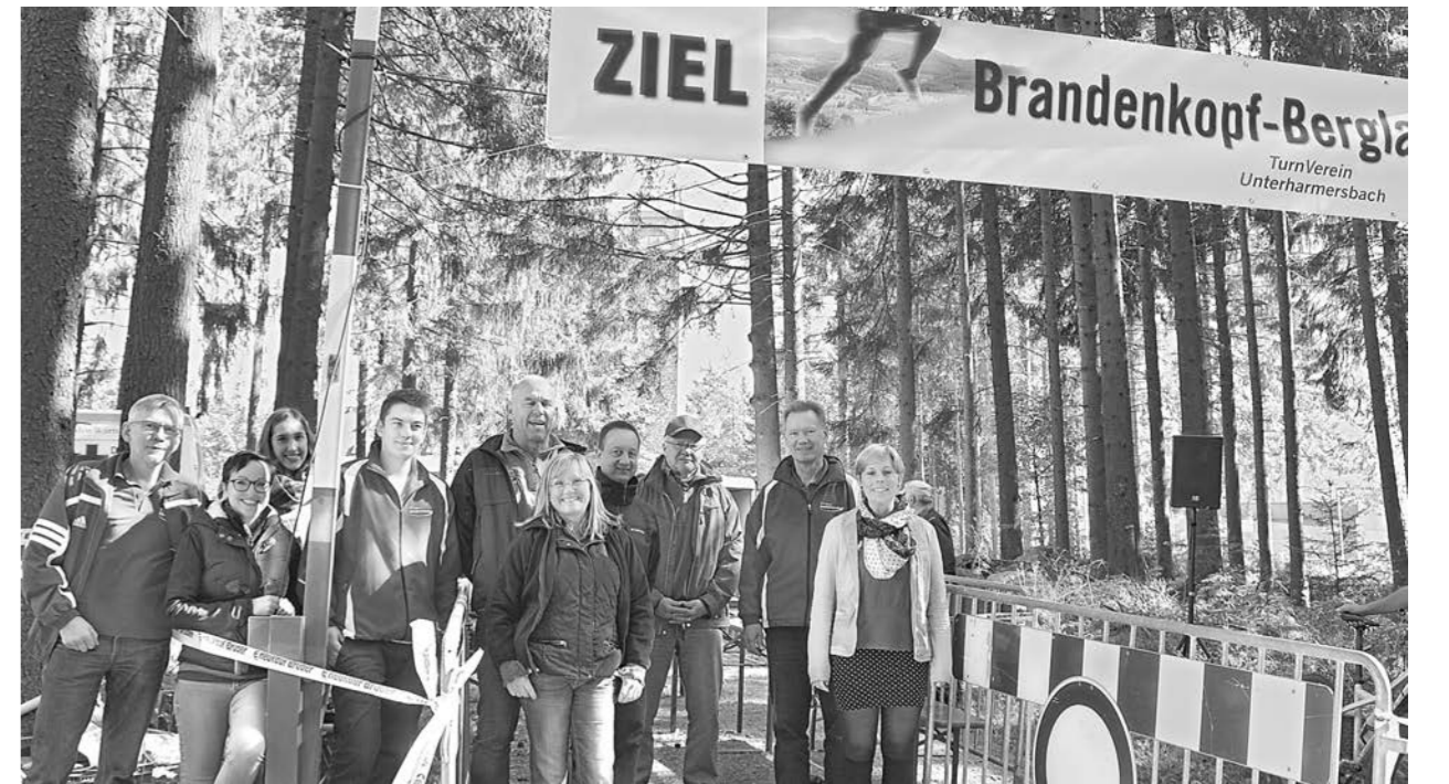
Die BBT-Challenge war auch eine Herausforderung für die Aktiven des Turnvereins Unterharmersbach. Über 100 Helfer waren an den drei Lauftagen im Einsatz. Unser Bild zeigt die Zieleinlauf-Mannschaft auf dem Brandenkopf.