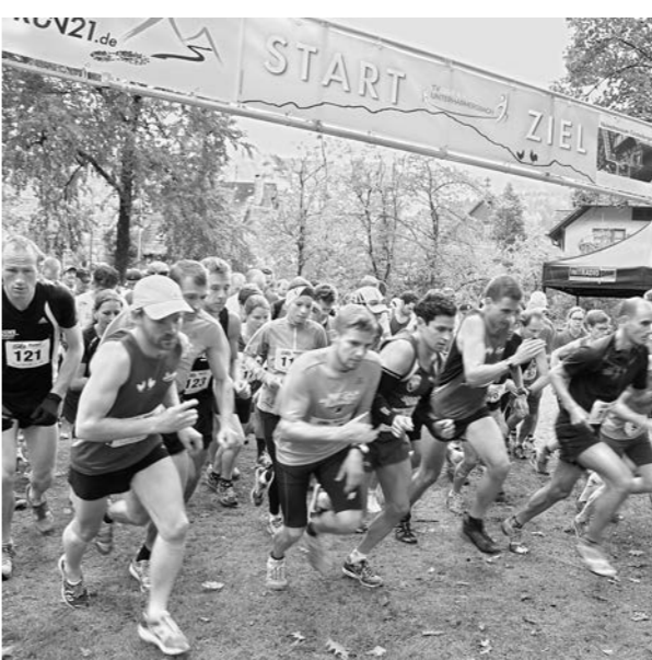
Start zum TrailRUN21 am Sonntag. Die Läufer waren voll des Lobes über den Streckenverlauf.